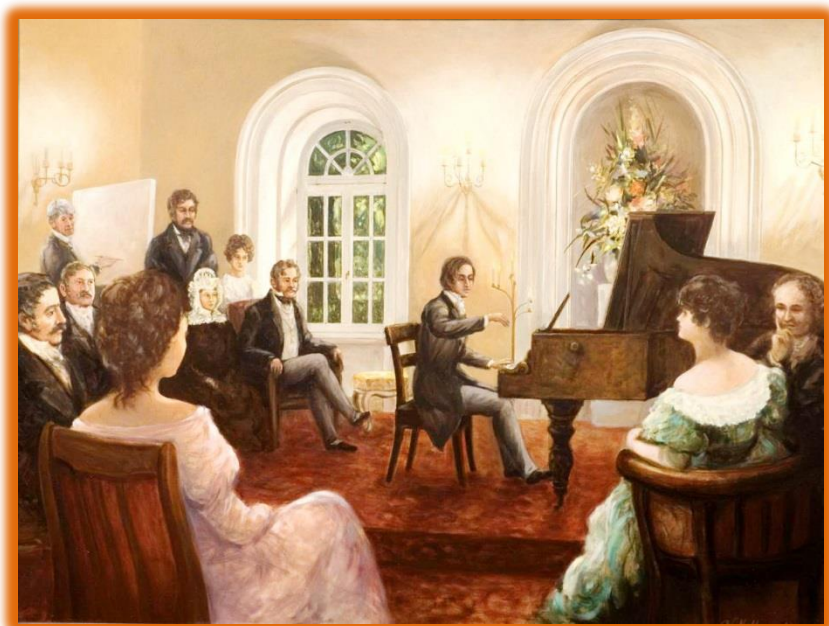
«Музыкальная жизнь Воронежа XIX век»

1. Игра на инструменте – это традиция и возможность быть в центре внимания Музыке учили всех аристократов, русских и европейских. Музицировать – это лоск, блеск и шик, апофеоз светских манер. Исполнитель на музыкальных инструментах всегда собирал вокруг себя слушателей.