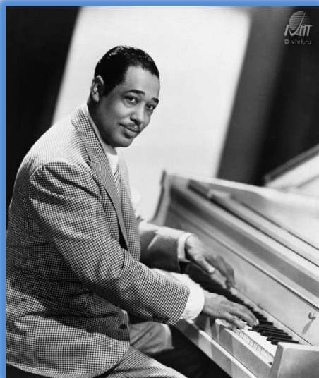
«Дюк Эллингтон – гений джазовой оркестровой музыки»

Как признавался Дюк Эллингтон, выдающийся мастер джаза, последней каплей, склонившей чашу весов в пользу музыки, а не беготни на улице была его неизменная популярность у девушек, которые, заслышав звуки рояля, спешили продемонстрировать пианисту свою симпатию.